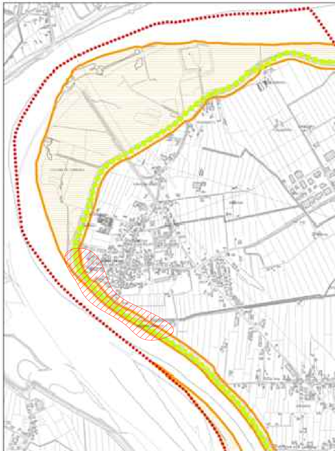
Stralcio da Cartografia " Invarianti "