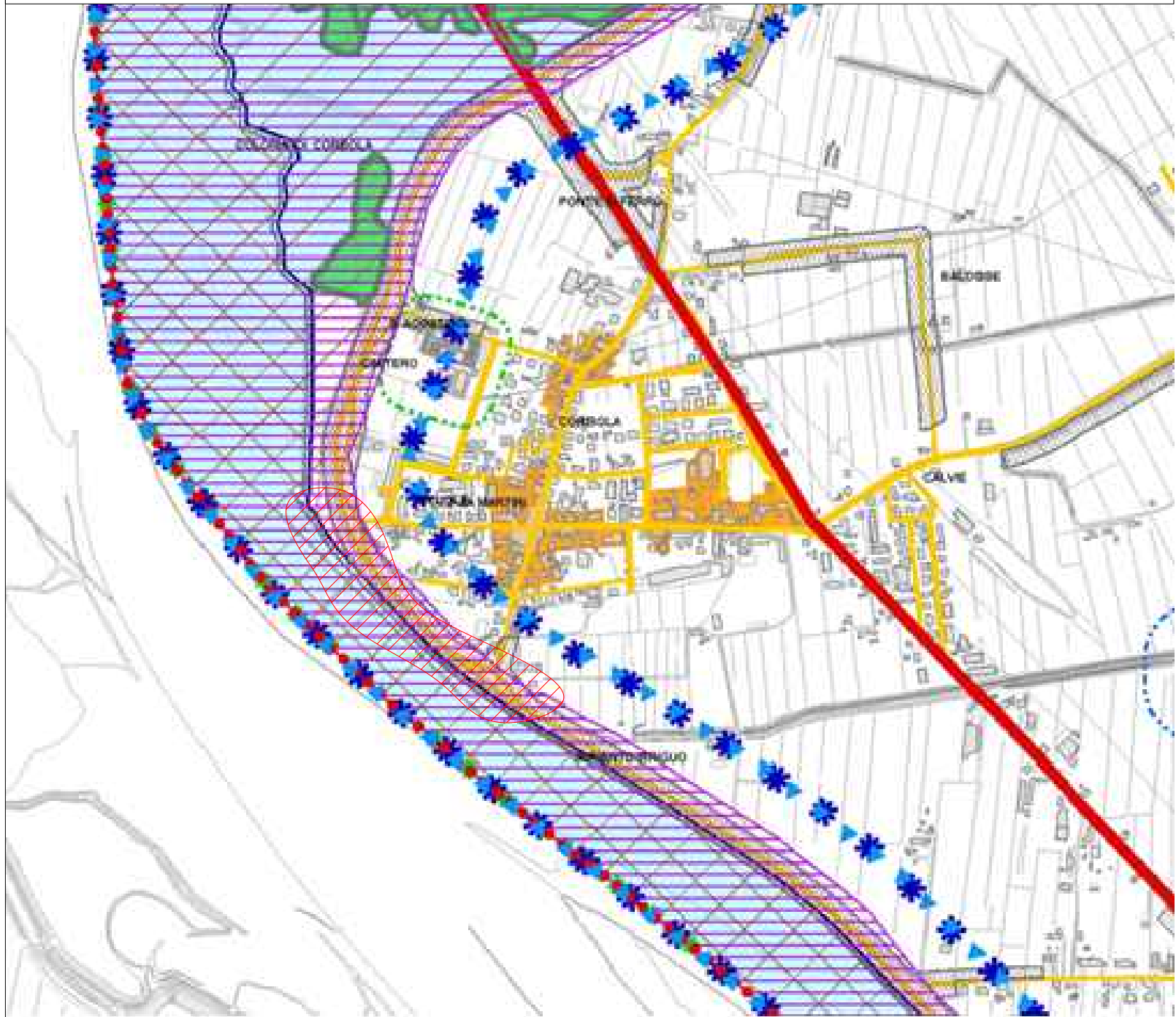
Stralcio da Cartografia " Vincoli e Pianificazione Territoriale "